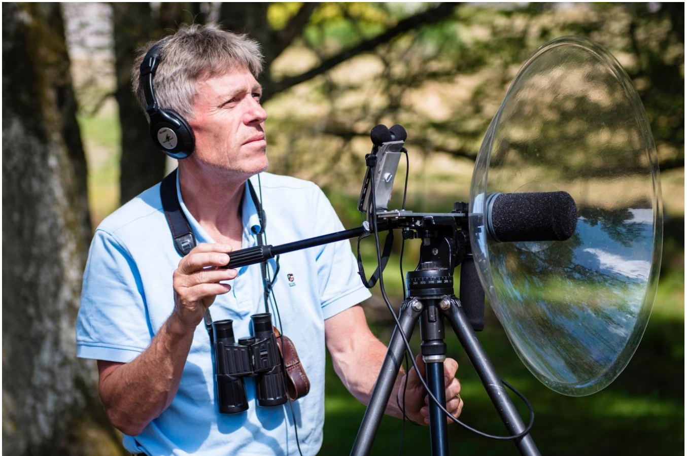
Bild 3. Parabolen och recordern monterad på stativ gör att man blir ”handsfree” och kan studera själva arten man spelar in.