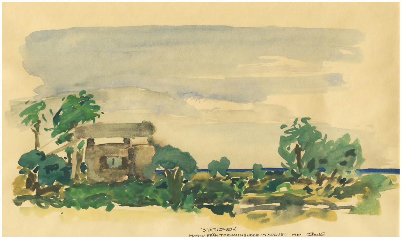
Akvarell över Torhamns fågelstation i augusti 1967 av Uffe Carlén.