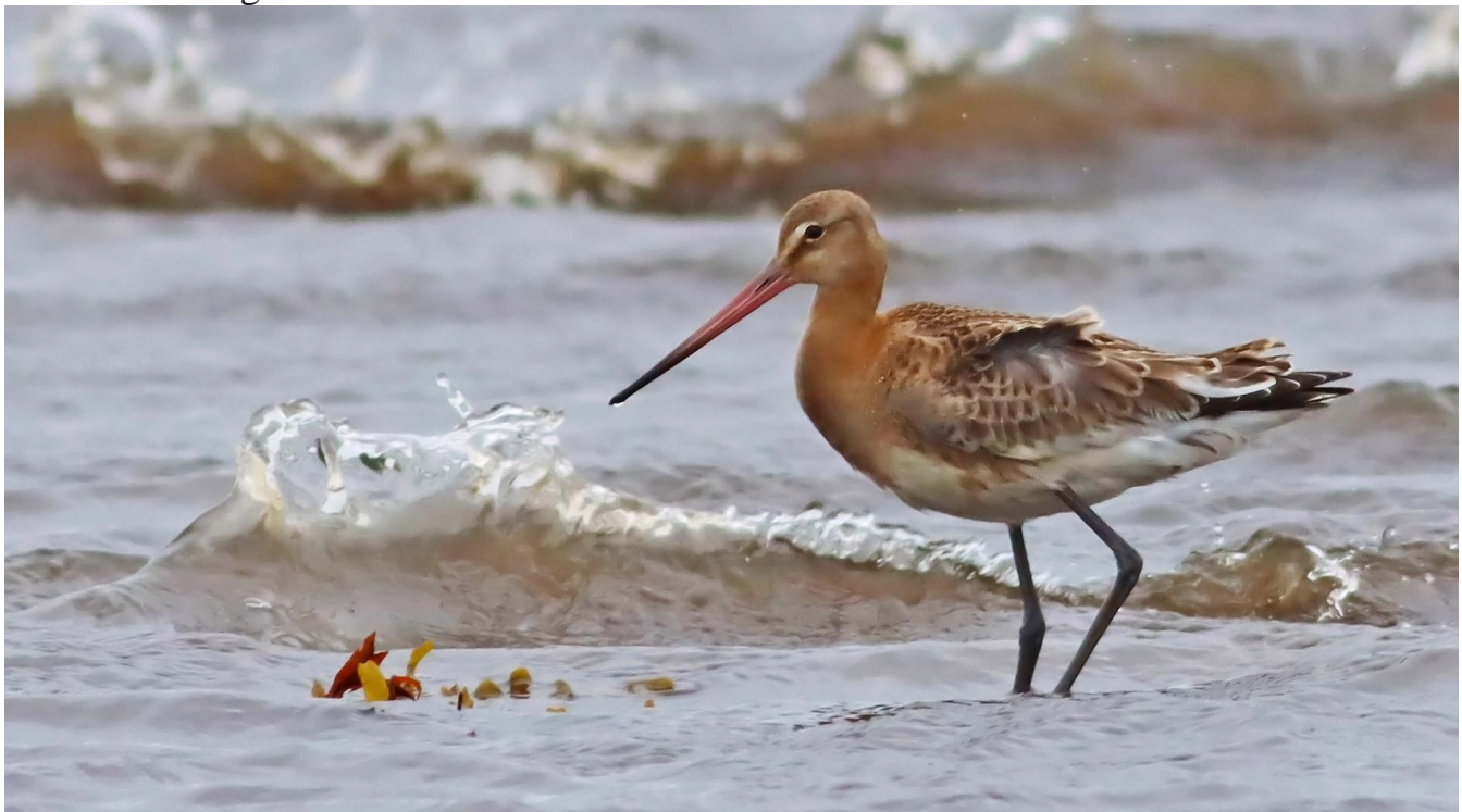
Isländsk rödspov 1K Olsäng 18.9 2021

Landskapets tredje samt fjärde fynd av denna underart. Tidigare fynd är från Lindö udde 4.10 2018 ( FBI 55: 53) och Utlängan 31.8-4.9 2001 ( FBI 39: 64). Under hösten skedde ett rekordartat inflöde av isländsk rödspov i landet med många fina flockar framförallt längs västkusten.