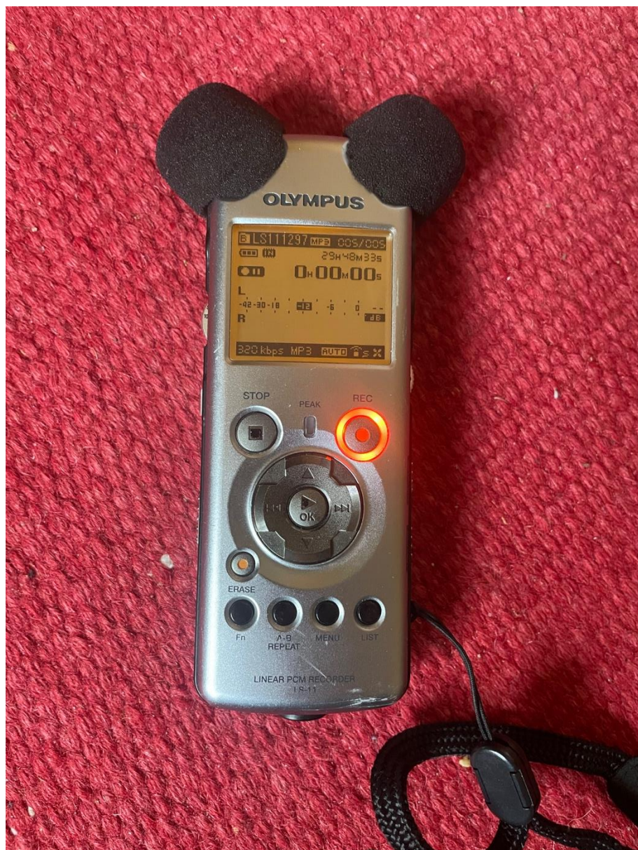
Bild 2. Olympus LS11 en mycket behändig recorder. Den kan försees med fjärrmanövrering, ställas i vänteläge samt försees med extra minneskort förutom det i själva recordern.