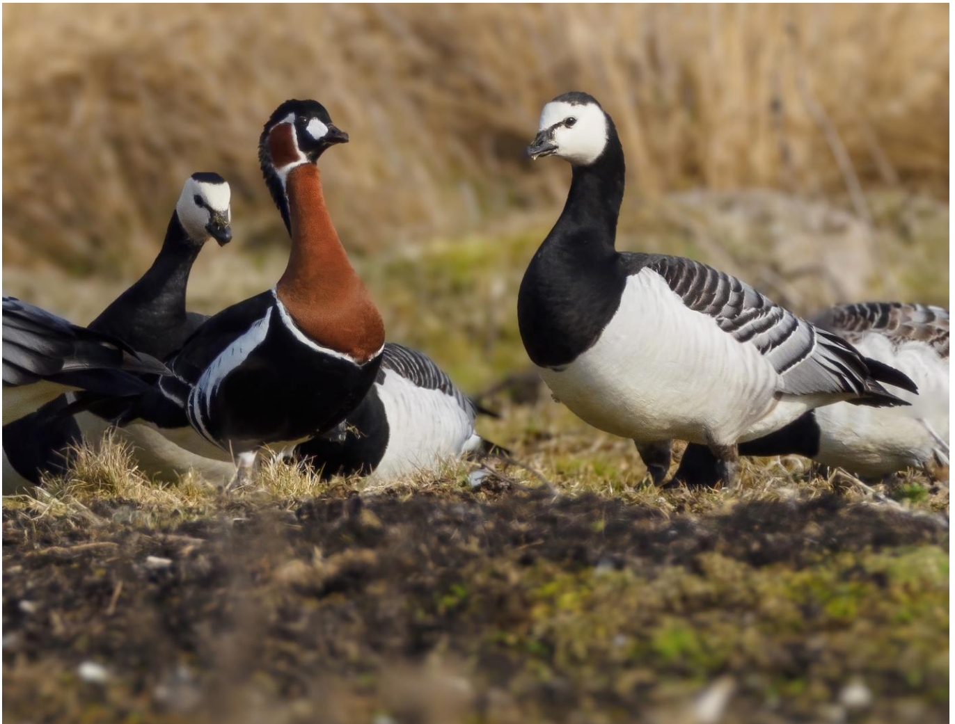
Rödhalsad gås, Torhamns udde 20/4 -21

Vårfynd har blivit allt vanligare i landskapet; av de nu 93 observerade exemplaren har 68 setts på våren och 25 på hösten. En förklaring till årstidsfördelningen kan vara att de arter den rödhalsade sträcker med (vitkindade gäss och prutgäss) överlag sträcker mer kustnära och inomskärs under våren än hösten och därmed är lättare att observera. Det vore därför intressant att ta del av fördelningen mellan vår- och höstfynd i de andra Östersjölandskapen Skåne, Öland och Gotland för att se hur det förhåller sig där. Arten får annars numera betraktas som årlig i landskapet; under 2000-talet saknas fynd endast år 2009.