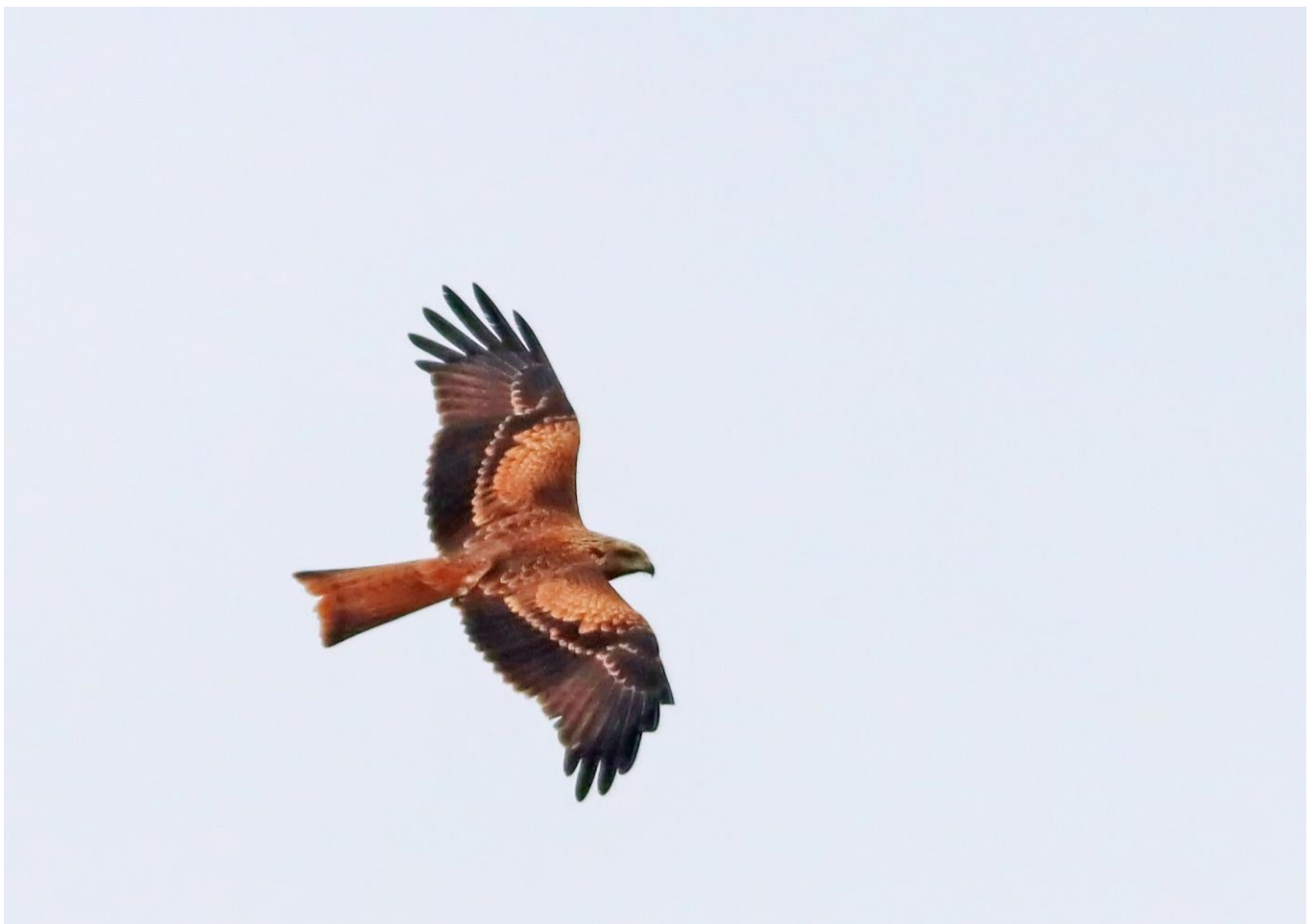
Brun glada x röd glada 1K Angelskog 16.9 2021

Första fyndet i landskapet av denna hybridform. Fågeln påminde på undersidan om en brun glada men var på ovansidan mer som en röd glada. Dessa glad-hybrider ses mer regelbundet i Skåne där bägge arterna förmodas ha samhäckt vid flera tillfällen.